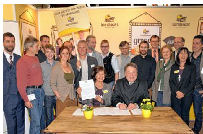
Unterschrift mit Minister: Im Beisein von Helmut Brunner haben Biobauern aus dem Landkreis die Kooperation mit einer Nachbarinitiative besiegelt.